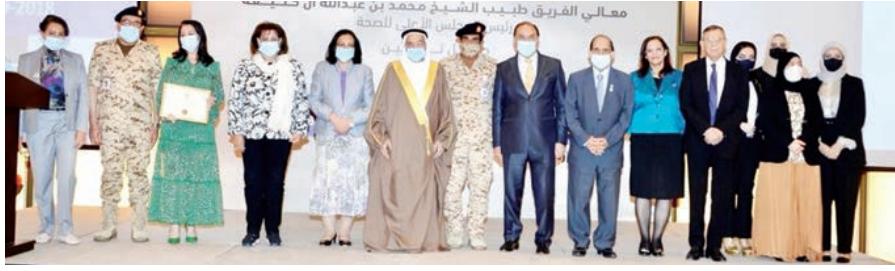
○ جانب من حفل تدشين الكتاب.